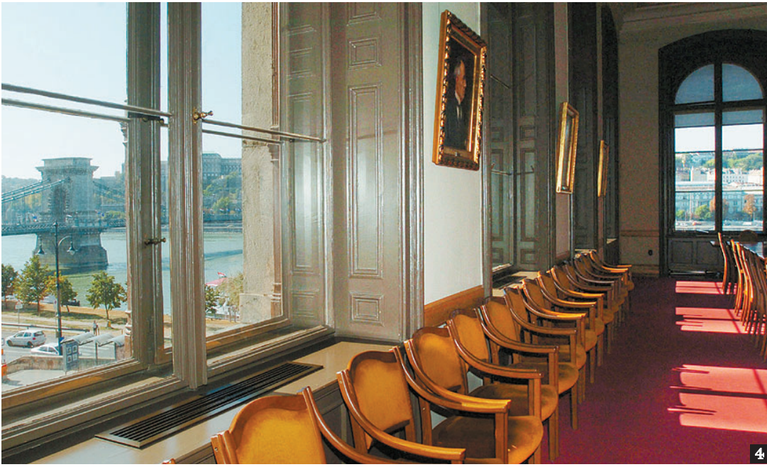
4. Az elnöki tanács- teremből nyílik a legszebb kilátás a budai oldalra és a Dunára 5. Az akadémiai könyv- tár épületét is utolérte a modernizáció 6. A képtár központi ter- me üvegtetőn át kap ter- mészetes megvilágítást