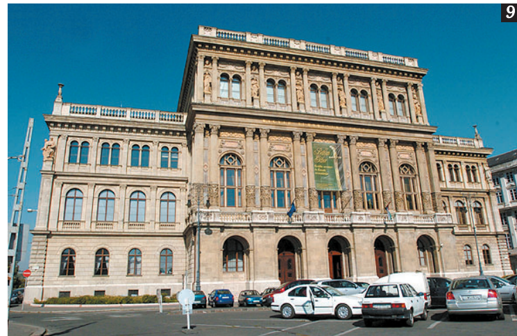
9. Az Akadémia palotája a historizáló neoreneszansz egyik első, ugyanakkor legértettebb példája Budapesten 10. Az elnöki tanács- teremben jól megférnek együtt az évszázados tudósportrék és a legmodernebb konferenciamikrofonok